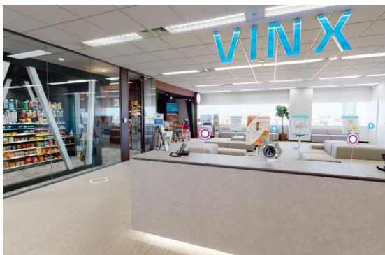
3Dで会場を自由に歩き回れます