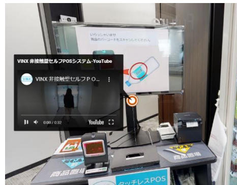
アイコンから様々なコンテンツを表示