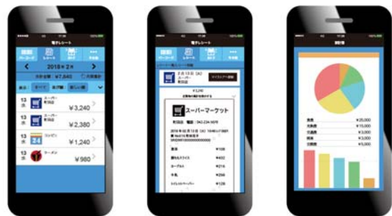
「スマートフォンの画面」

* 1: 今回の実証実験のために実装された機能であり、今すぐ商品化されることを保証するものではありません。